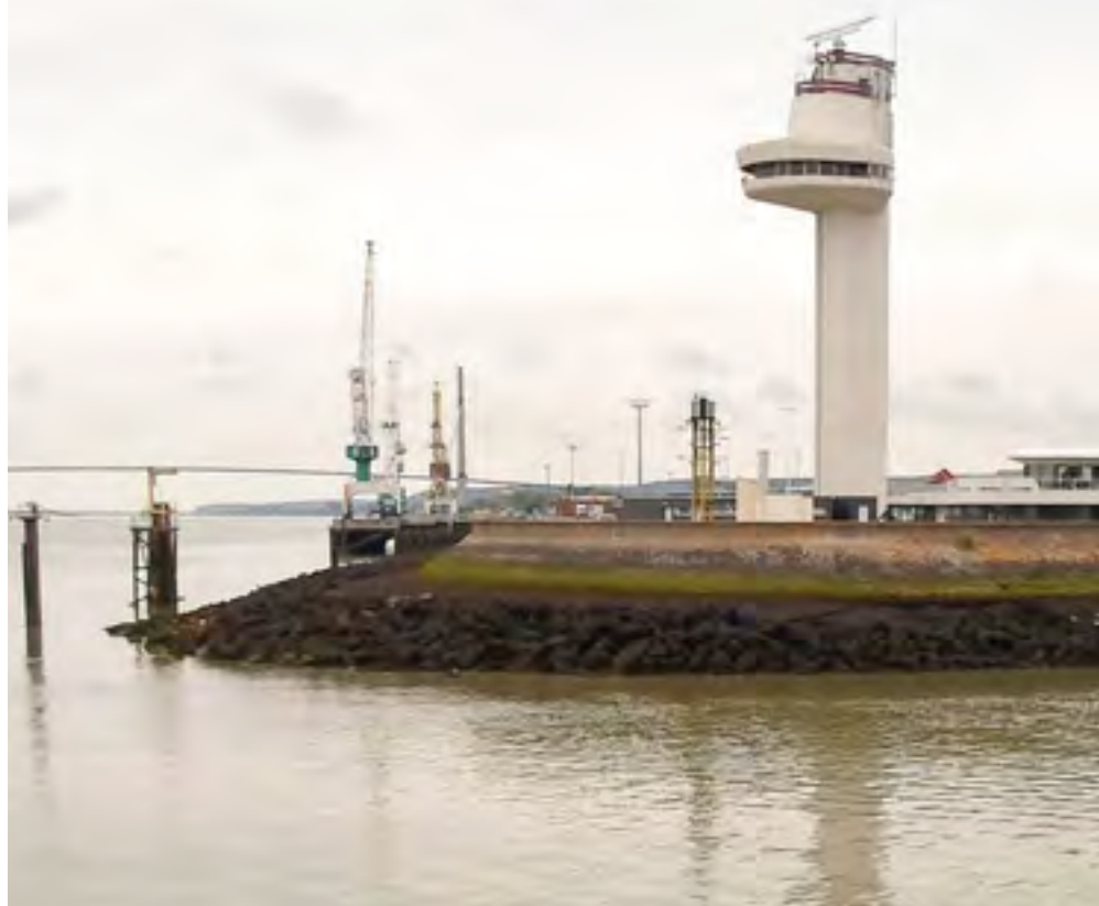
INGANG VAN DE SLUIS BIJ HONFLEUR.