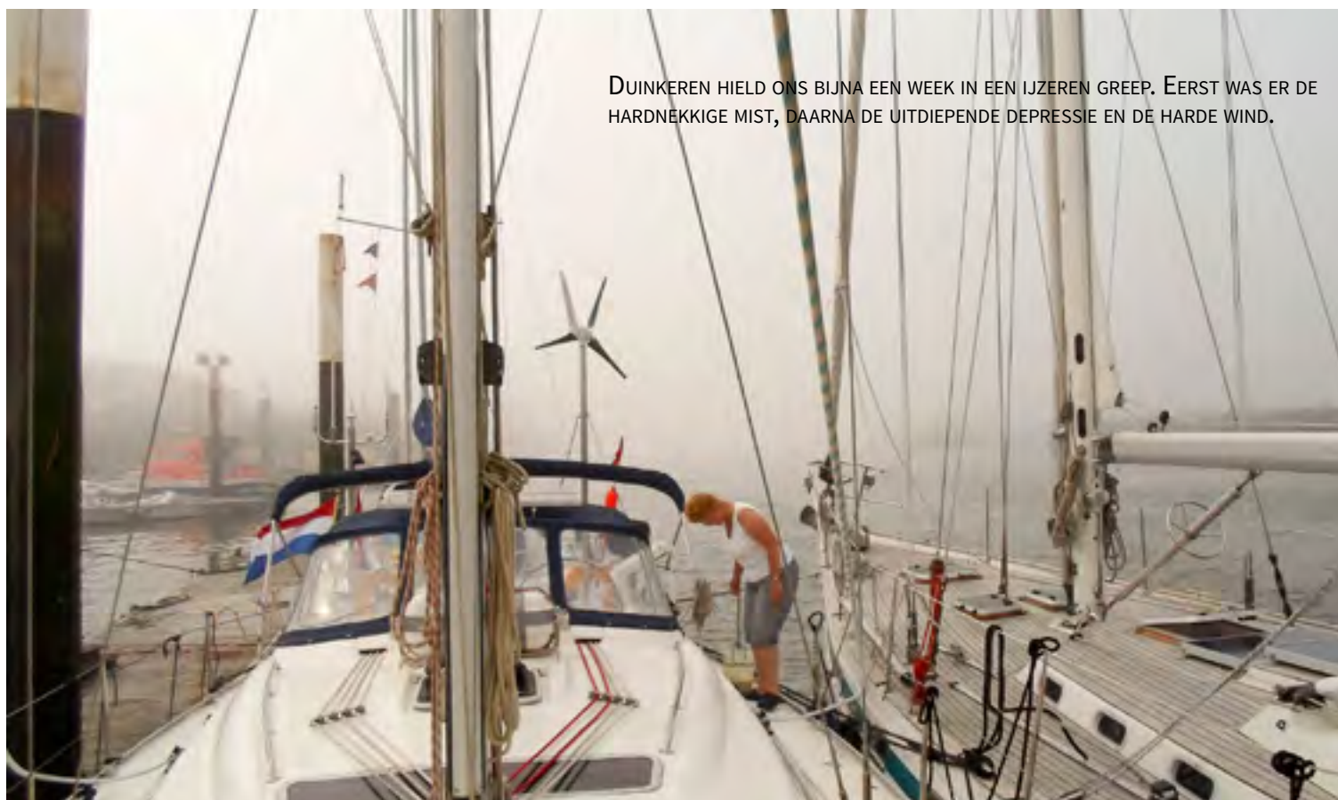
DUINKEREN HIELD ONS BIJNA EEN WEEK IN EEN IJZEREN GREEP. EERST WAS ER DE HARDNEKKIGE MIST, DAARNA DE UITDIEPENDE DEPRESSIE EN DE HARDE WIND.

Aanvankelijk zag ons plan er heel anders uit. We wilden alleen enkele reizen boeken, zodat we niet bij het begin van een zeiltocht al met de terugreis bezig zouden zijn.