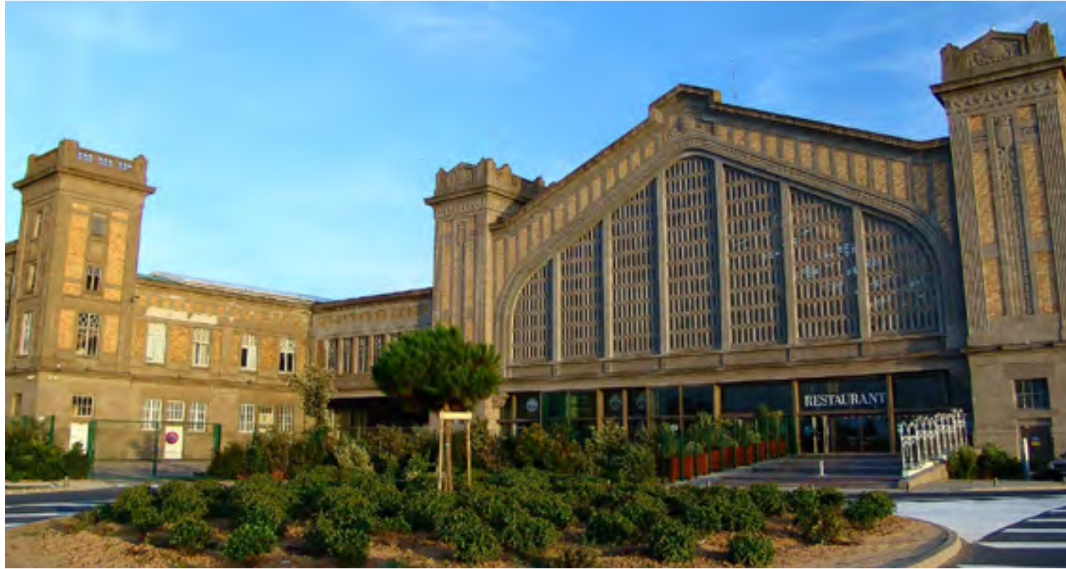
LA CITÉ DE LA MER IN CHERBOURG, DE VOORMALIGE PASSAGIERSTERMINAL, IS NU EEN MARITIEM MUSEUM.

kende belevenis. De attracties zijn ondergebracht in de voormalige passagiersterminal, een van de plekken die de Titanic op 10 april 1912 aandeed voordat de reis naar Amerika aanving en waar bijvoorbeeld in 1929 bijna 200.000 emigranten inscheepten voor een toekomst in de Nieuwe Wereld. Zie ook www.citedelamer.com en www.cherbourg-titanic.com . Informatie over Cherbourg staat op www.cherbourgtourisme.com .