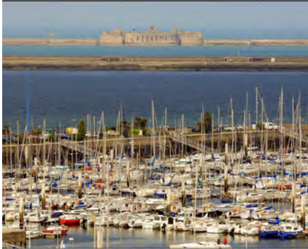
PORT CHANTEREYNE IN CHERBOURG, VOOR PASSANTEN ZIJN ER 250 LIGPLAATSEN.

radar zien we inmiddels de toegang van de enorme kunstmatige haven van Cherbourg (1500 ha), ooit aangelegd in opdracht van Napoleon.