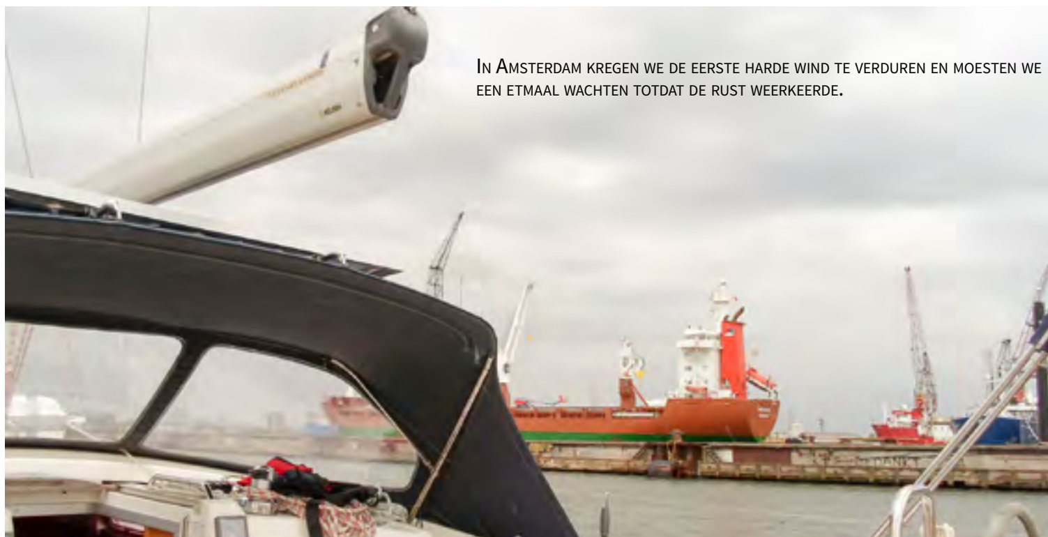
IN AMSTERDAM KREGEN WE DE EERSTE HARDE WIND TE VERDUREN EN MOESTEN WE EEN ETMAAL WACHTEN TOTDAT DE RUST WEERKEERDE.